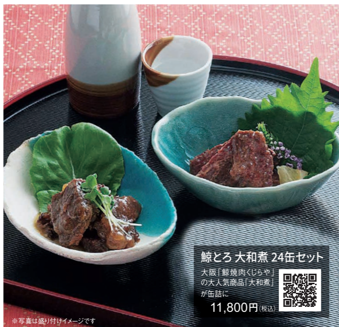
※写真は盛り付けイメージです

「いつもより少し贅沢しておいしいものを食べたい」 「自宅に居ながら旅行気分を楽しみたい」というお客様の声にお応えし、 通年で楽しめるお取り寄せグルメ商品を取り扱っております。