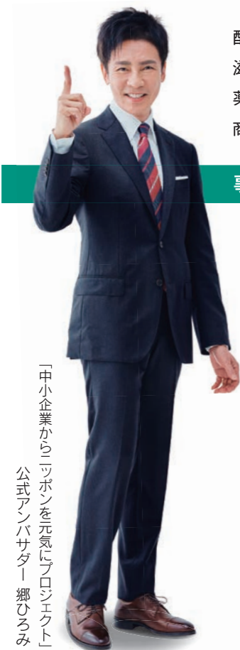
「中小企業からツボンを元気にプロジェクト」 公式アンバサダー 郷ひろみ

急な 頭痛 発熱 腹痛 切り傷 鼻炎 など いつでも「薬」が使えて手間いらず! とっても便利!